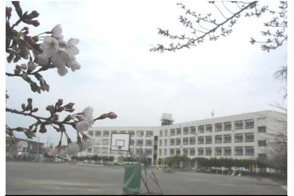
本校児童と校舎を見守る桜

本年度も、いろいろな思いをもった児童、保護者や地域の皆様、教職員等、学校に関わるすべての人たちが「行こう」と思える学校にしたいと考えています。そのために、「不易」と「流行」を組み合わせた教育活動を進めてまいります。