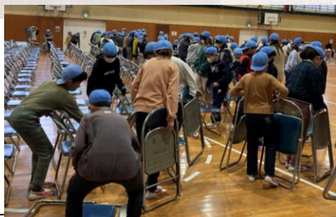
「つゆくさの清さ根強さ持つわれら」