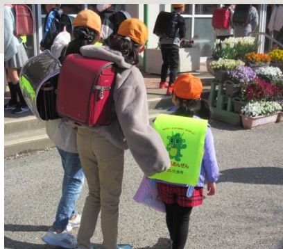
「島の学びやあたたかく」

3番からは、未来を見つめて、自分たちで学校をつくっていくぞ、という決意が込められています。