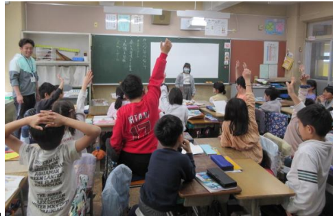
「ひかりの中で伸びあがる」