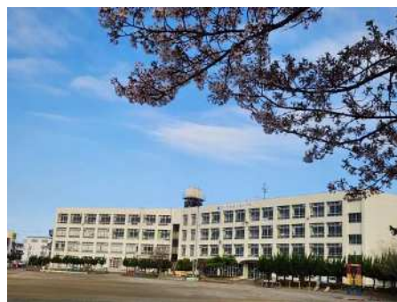
満開の桜と本校校舎

また、新たに着任いたしました教職員に対しましても、引き続きご支援を賜りますようお願い申し上げます、新年度スタートにあたってのあいさつといたします。